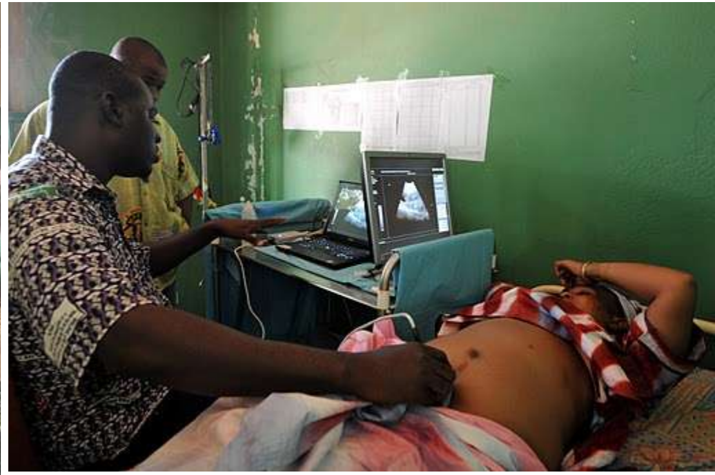
Visite de terrain à Bankass